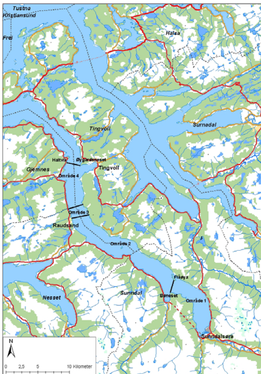
Områdeinndeling av Sunndals-/Tingvollfjorden

Det totale tiltaksområdet tilsvarar området underlagt kosthaldsråd i 2002 av Statens Næringsmiddeltilsyn (no Mattilsynet).