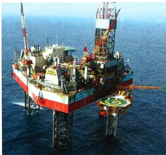
Jack-up riggen Mærsk Guardian

Søknad om tillatelse til virksomhet etter forurensningsloven