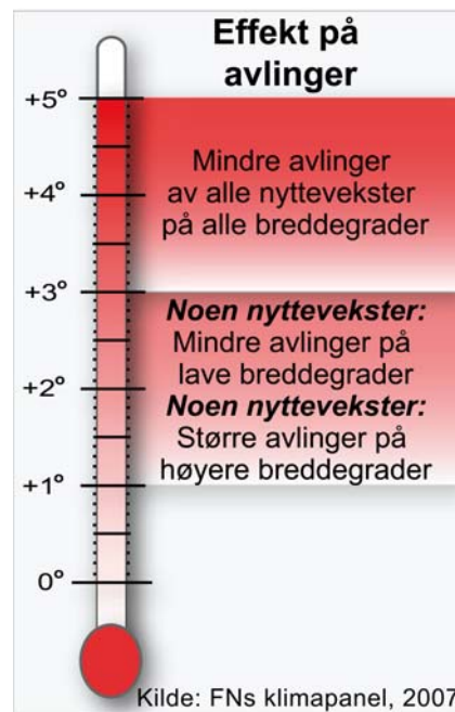
Figur 2. Ved opp til 3 grader Celsius økning i global gjennomsnittstemperatur vil verdens potensial for matproduksjon antakelig øke, for deretter å avta kraftig.

Arktiske bosettinger har tradisjonelt høy tilpasningsevne, men både interne og eksterne faktorer utfordrer tilpasningsevnen og truer tradisjonelle levesett.