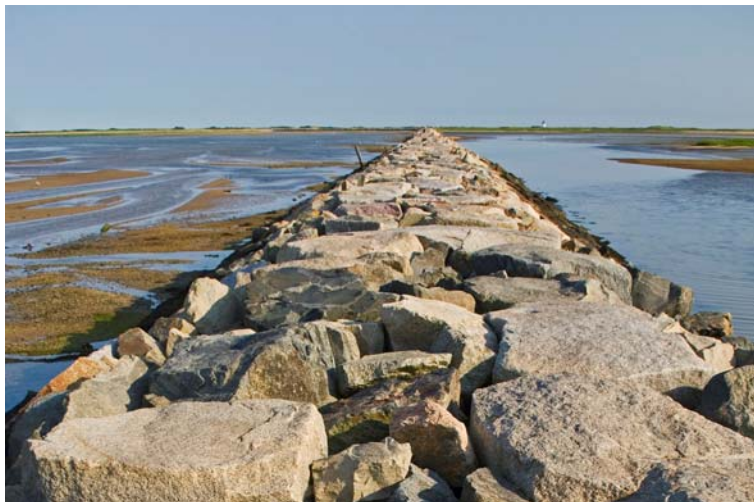
I Nederland beskytter diker som denne landområder og befolkningen fra havet.